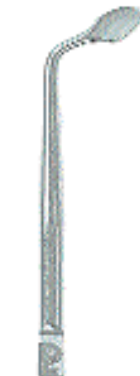
0296-26 Fig. 26