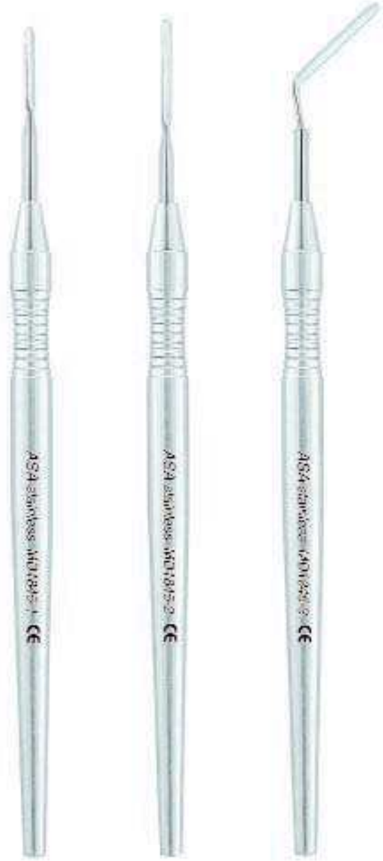
MD1845-1 Fig. 1