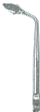
0296-7 Fig. 7