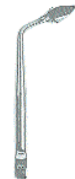
0296-6 Fig. 6