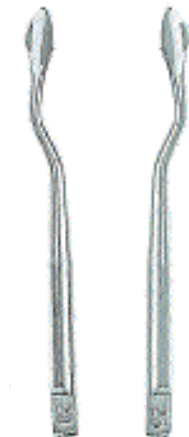
0296-24 Fig. 24