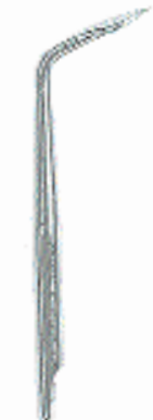
0296-29 Fig. 29