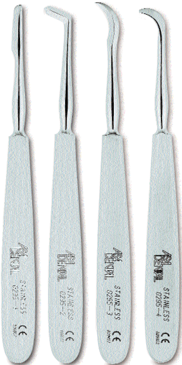
0295-1 Fig. 1 Chompret

● 0295-3 Sindesmotomo di Chompret a "falce" Chompret syndesmotome, sickle pattern