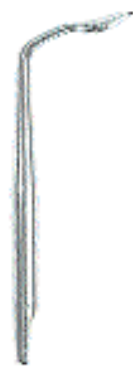
0296-9 Fig. 9