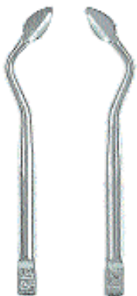
0296-22 Fig. 22