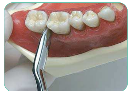
0203-1 Leva Lecluse per lussazione ottavo inferiore Lecluse elevator for lower third molar dislocation