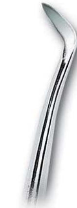
0202-351 Fig. 351 Walter F. Barry