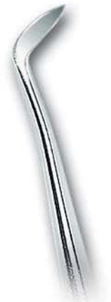
0202-370 Fig. 370 Walter F. Barry