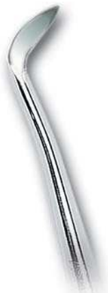
0202-350 Fig. 350 Walter F. Barry