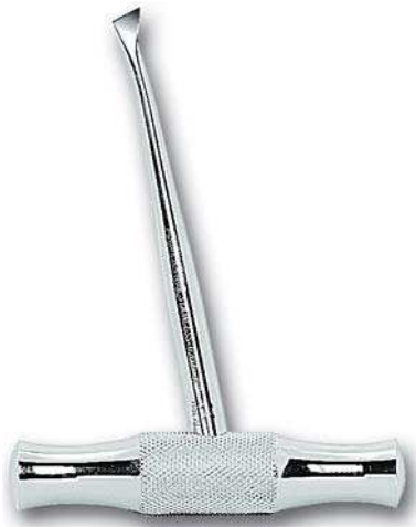
Walter F. Barry

■ Con manico in acciaio inossidabile With stainless steel handle