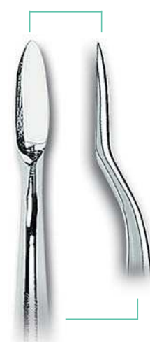
0203-1 Fig. 1LC Lecluse