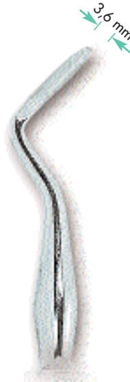
0234-3 Fig. 3 Hylin