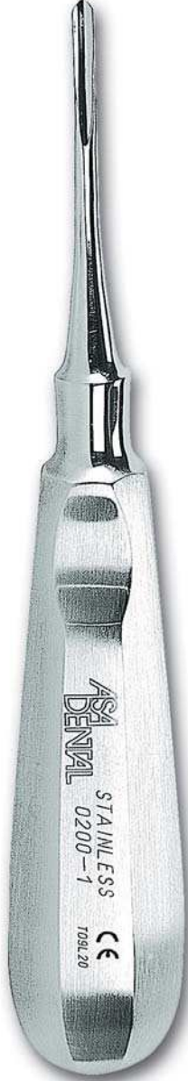
0200-1 Fig. 1B Bein