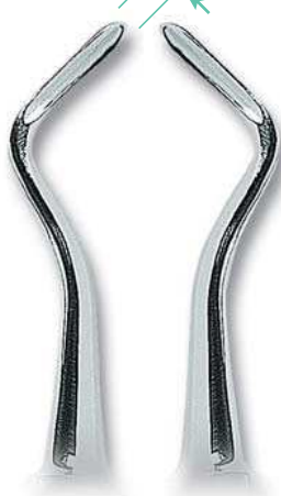
0201-2 Fig. 2F Flohr