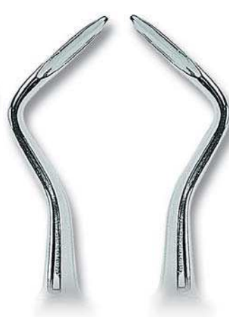
0205-4B Fig. 4B SA Schmeckebier Apexo