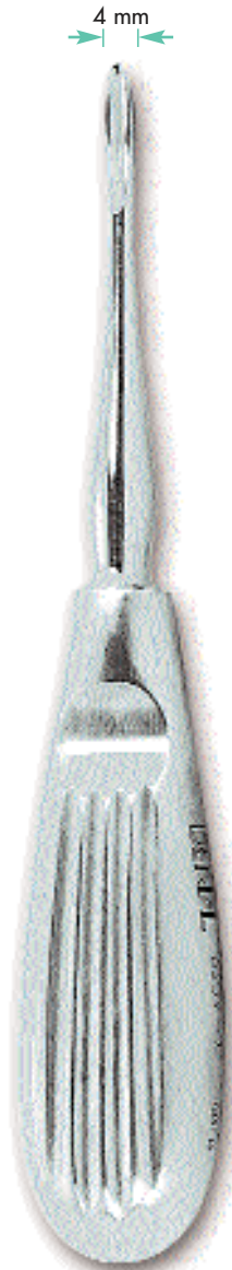
0234-1 Fig. 1 Hylin