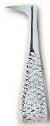
0233-2 Fig. 2