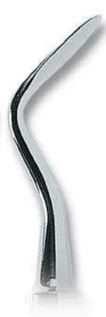
0205-4 Fig. 4 SA Schmeckebier Apexo