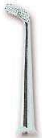
0231-3 Fig. 3 London Hospital