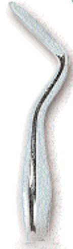
0234-4 Fig. 4 Hylin