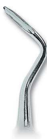
0205-5B Fig. 5B SA Schmeckebier Apexo