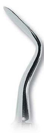
0205-5 Fig. 5 SA Schmeckebier Apexo