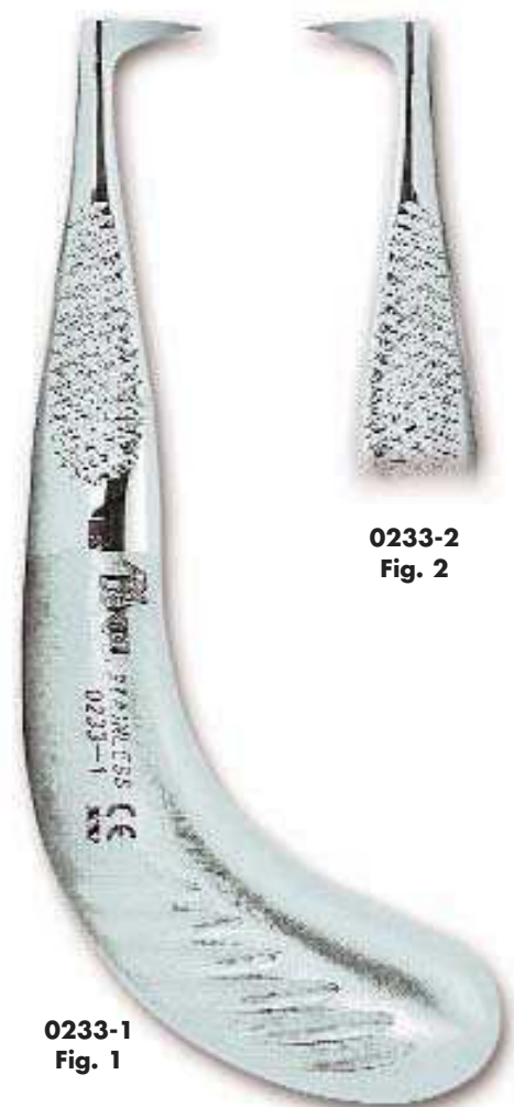
0233-1 Fig. 1